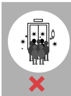
© HRPBW – Kabinet Minister Muylle – FOD Werkgelegenheid